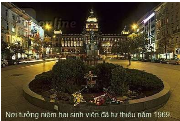
Nơi tưởng niệm hai sinh viên đã tự thiêu năm 1969

10.228.744 người, mật độ khoảng 130 người/km 2 . Diện tích 78.860 km 2 , là quốc gia đa đảng theo chế độ dân chủ nghị viện. Tổng thống hiện nay là ông Václav Klaus là người đứng đầu quốc gia, còn thủ tướng là người đứng đầu chính phủ. Quốc hội có hai viện gồm thượng viện và hạ viện. Từ năm 2000 được chia thành 13 khu vực (kraje hoặc kraj) và thủ đô là Praha, mỗi khu vực có một Hội đồng địa phương (krajské zastupitelstvo), được bầu cử và người lãnh đạo riêng (hejtman). Hệ thống hành chính điều hành ở Praha có Hội đồng thành phố và thị trưởng là ông Bohuslav Svoboda. Năm 1784 là thủ đô hoàng gia Praha, từ năm 1920 Praha là thủ đô và thành phố lớn nhất Cộng Hòa Tiệp Khắc không bị chiến tranh tàn phá nên vẫn giữ nguyên các nét đẹp cổ kính, dân số Praha 1,2 triệu người, không kể khoảng 300.000 người vào làm việc tại thành phố, Praha diện tích 496 km 2 là trung tâm kinh tế, văn hoá và chính trị của CH.Czech hơn 1000 năm. Từ năm 1992 Praha được UNESCO công nhận là Di sản thế giới.